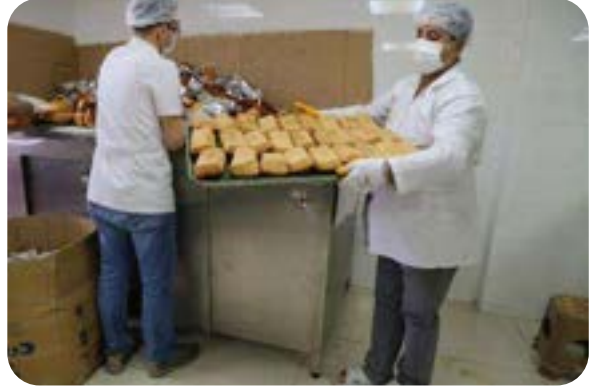
“HOŞGELDİN BEBEK” PROJESİ

İLÇEMİZDE YENİ DOĞAN BEBEKLER İÇİN AİLELERE Puset ve Çanta YARDIMINDA BULUNUYORUZ.