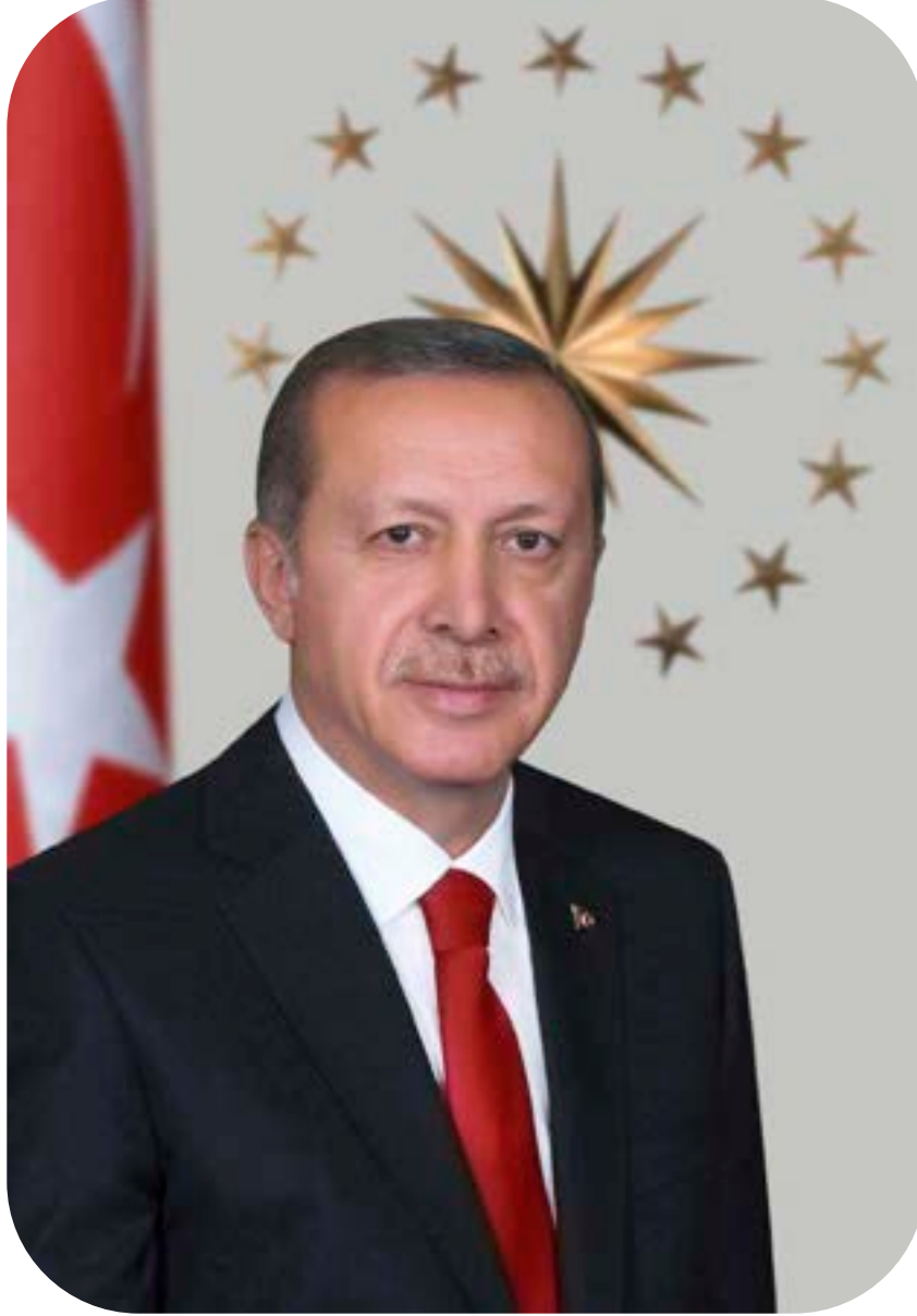
Recep Tayyip ERDOĞAN CUMHURBAŞKANI