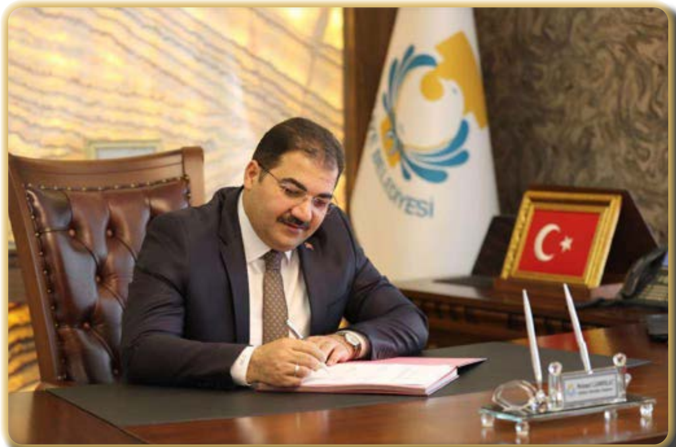
Mehmet CANPOLAT Halilîye Belediye Başkanı