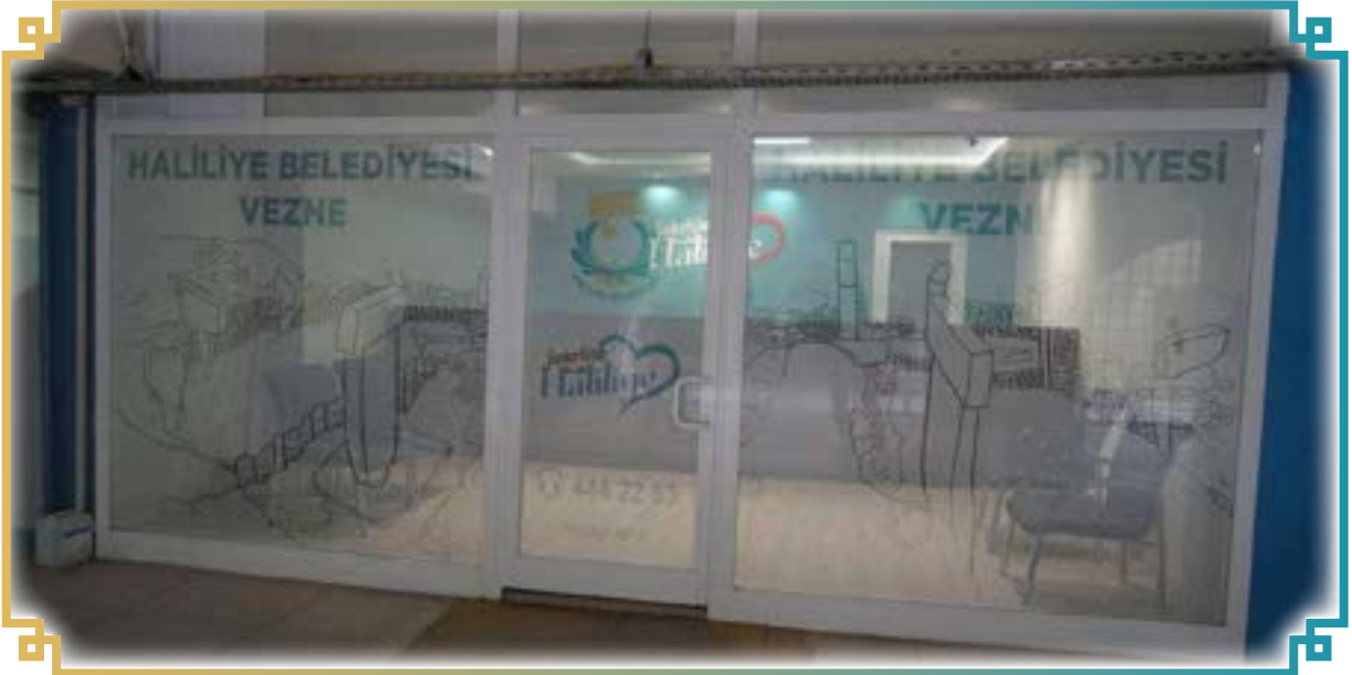
Ahmet Bahçivan İşmerkezi Binası, Haliliye Belediyesi Veznesi 63100 Haliliye/ŞANLIURFA