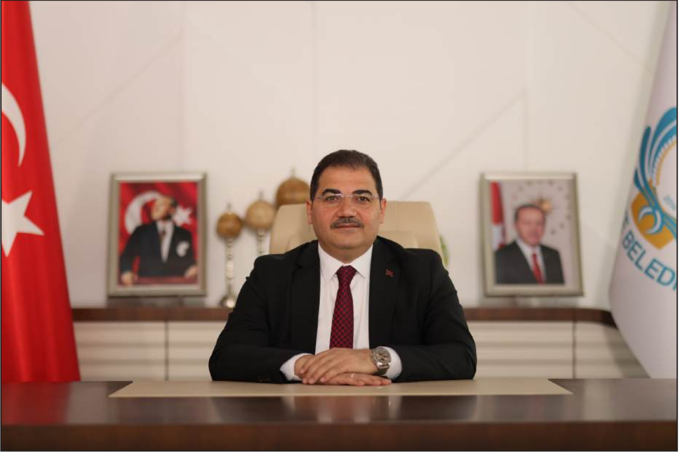
Mehmet CANPOLAT Halilîye Belediye Başkanı