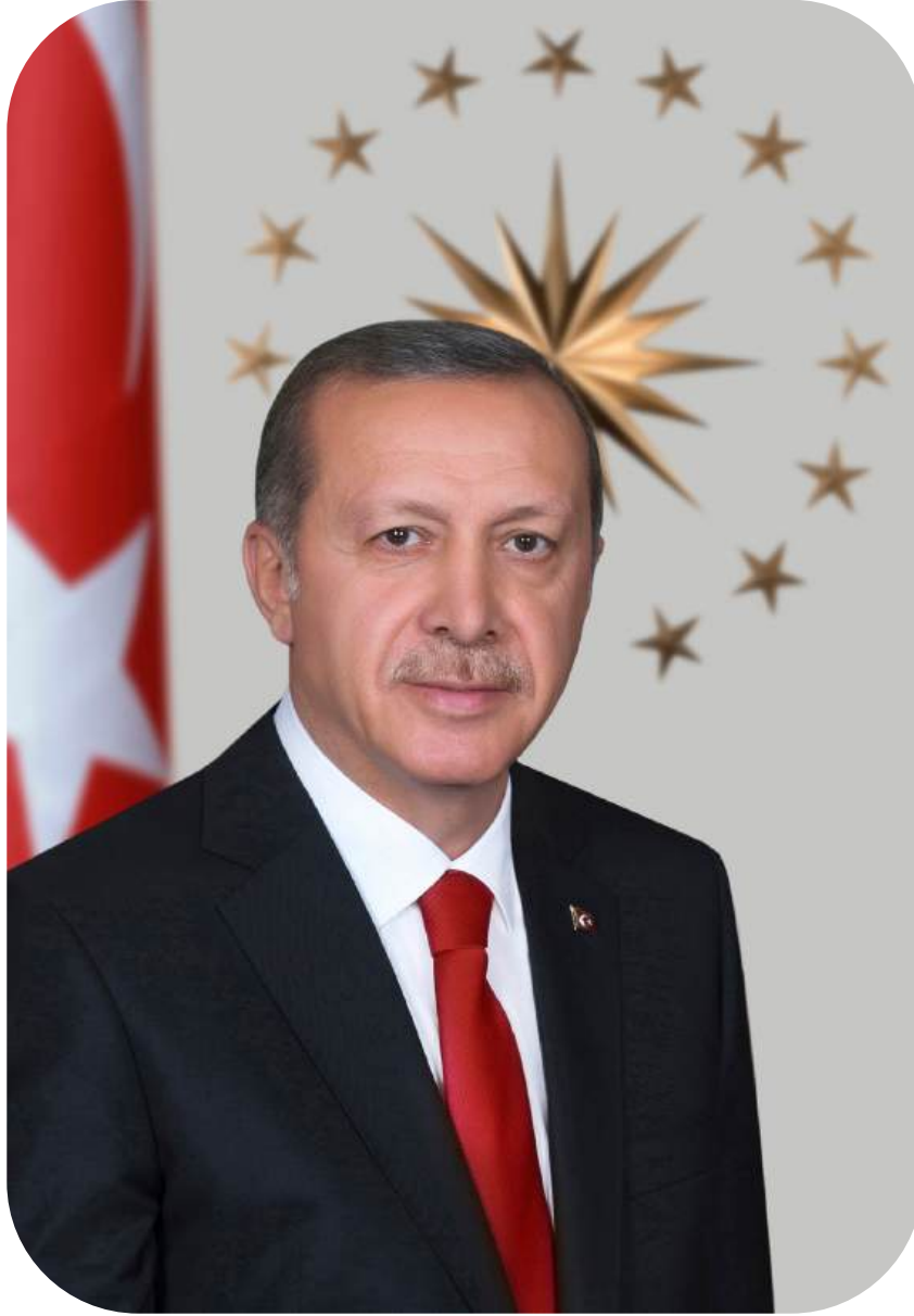
Recep Tayyip ERDOĞAN CUMHURBAŞKANI